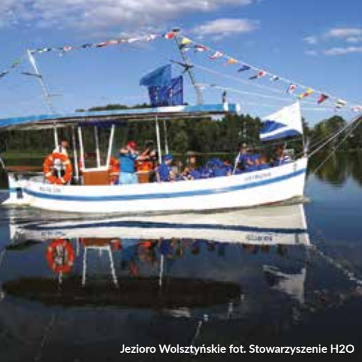
Jezioro Wolsztyńskie