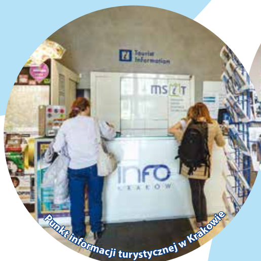
Punkt informacji turystycznej w Krakowie

Co wybrać z tej bogatej oferty? Jakie miejsca odwiedzić w pierwszej kolejności? Gdzie nocować? Co zjeść? Warto odnaleźć własny klucz do odkrywania Małopolski... Pomoże w tym „Małopolski System Informacji Turystycznej” „MSIT”!