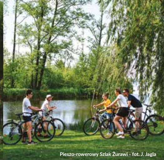
Pieszno-rowerowy Szlak Żurawi

Leżąca na zachodniej granicy województwa Gmina Wolsztyn stanowi doskonałą wizytówkę Wielkopolski witającą turystów z kraju i zagranicy hasłem „Wolsztyn pełną parą...”