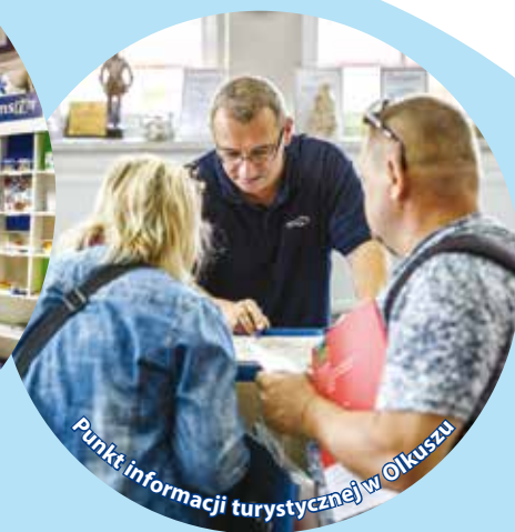
Punkt informacji turystycznej w Olkuszu