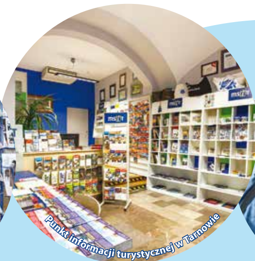
Punkt informacji turystycznej w Tarnobrzegu