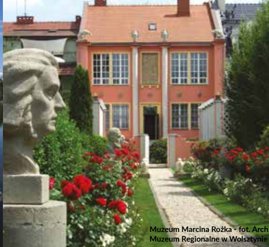
Muzeum Marcina Rożka