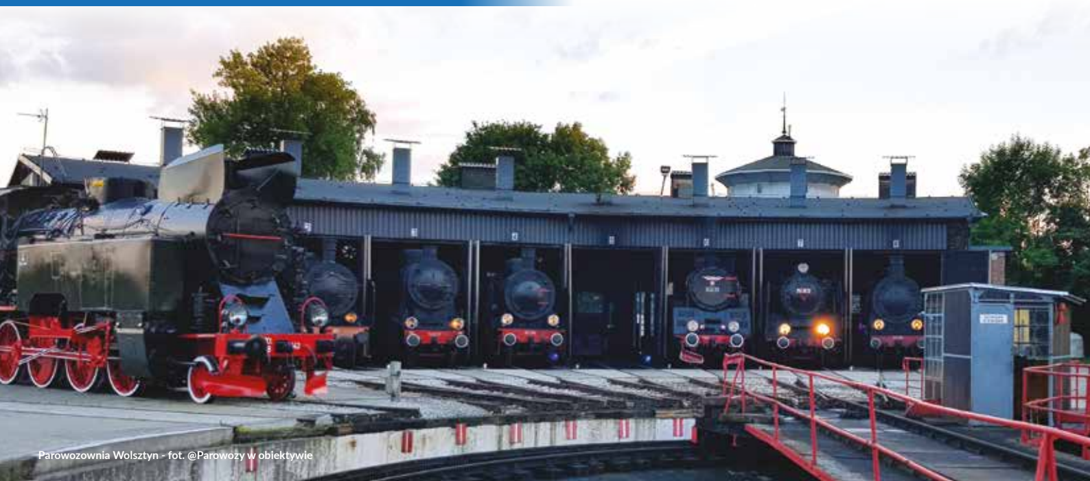
Parowozownia Wolsztyn

INFORMACJA TURYSTYCZNA Biuro Promocji i Turystyki Urzędu Miejskiego w Wolsztynie ul. Doktora Kocha 12a 64-200 Wolsztyn tel.68 347 31 04 www.wolsztyn.pl